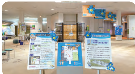
ゆめ地創館と地層処分実規模試験施設を ご案内(地上施設見学会・地下施設見学会共通)