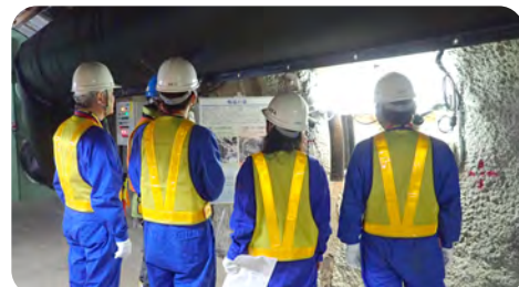
職員による研究内容の分かりやすい説明 (地上施設見学会・地下施設見学会共通)